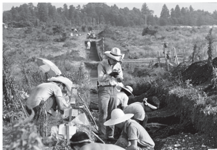
南貝塚の大発掘・長いトレンチと地形(1964)