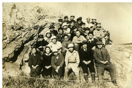
国営発掘調査参加者集合写真(1951)