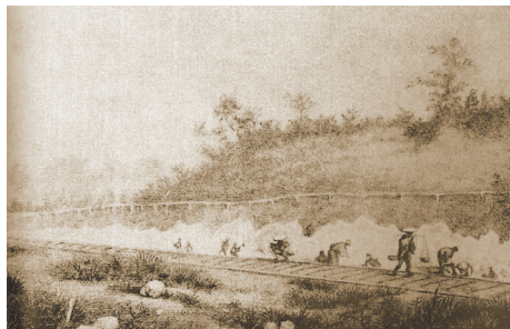
報告書『大森貝塚』の口絵スケッチ(1879)

1962年宮城県生まれ。宮城教育大学教育学部卒業。東北大学大学院医学系研究科修士課程修了。宮城県教育委員会を経て、2000年より奥松島縄文村歴史資料館勤務。大学1年の時から里浜貝塚の発掘に参加。「さとはま縄文の里史跡公園」整備に関わる。主な業績に『里浜貝塚総括報告書』（2025）