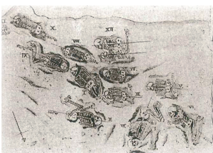
里浜貝塚人骨の出土状況スケッチ(1919)